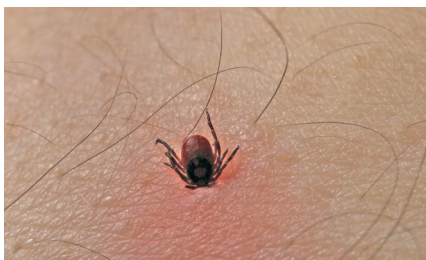
Teken bijten zich vast in de huid.

Teken kruipen op dieren of mensen en bijten zich vast om bloed op te zuigen. Teken bijten vooral in het voorjaar, de zomer en de herfst. Mensen die veel in de natuur zijn en kinderen die buiten spelen hebben vaker tekenbeten.