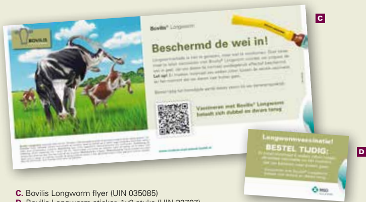
C. Bovilis Longworm flyer (UIN 035085) D. Bovilis Longworm sticker, 1x8 stuks (UIN 32707)