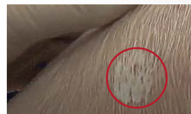
Dit is een voorbeeld van te veel schuim: Herhaal in dit geval de vaccinatie.