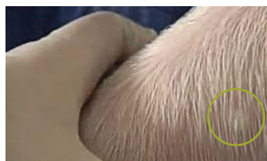
Er mag een beetje schuim aan het oppervlakte zichtbaar zijn!