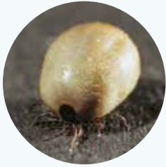
Teek volgezogen met bloed.