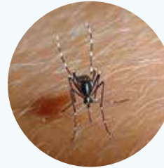
De hartwormmug komt op veel plekken in de wereld voor. Als de hartwormmug u of uw hond steekt, kan dit hevige jeuk veroorzaken.