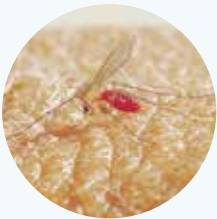
Door de beet van een zandvlieg kan uw hond besmet raken met de Leishmania-parasiet.

De beste manier om de kans op tekenziekten te verminderen, is om uw hond langwerkend tegen teken te beschermen met een tekenmiddel. Er zijn ook middelen verkrijgbaar, die uw hond zowel tegen teken als vlooiën beschermen. Houd er wel rekening mee dat er geen enkel tekenmiddel voor honden bestaat dat uw hond altijd 100% beschermt tegen teken. Daarom is het belangrijk om uw hond ook dagelijks te controleren op teken. Als er dan toch nog teken aangehecht zijn, is het belangrijk deze zo snel mogelijk te verwijderen. Uw dierenarts vertelt u graag meer.