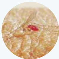
Door de beet van een zandvlieg kan uw hond besmet raken met de Leishmania-parasiet.

De beste manier om de kans op tekenziekten te verminderen, is om uw hond langdurig tegen teken te beschermen met een tekenmiddel. Bescherm uw hond van maart tot en met november tegen teken, en ook tijdens warme winters. Er zijn ook middelen verkrijgbaar, die uw hond zowel tegen teken als vlooien beschermen. Houd er wel rekening mee dat er geen enkel tekenmiddel voor honden bestaat dat uw hond altijd 100% beschermt tegen teken. Daarom is het belangrijk om uw hond ook dagelijks te controleren op teken. Als er dan toch nog teken aangehecht zijn, is het belangrijk deze zo snel mogelijk te verwijderen. Uw dierenarts kan u hierover adviseren.