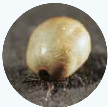
Teek volgezogen met bloed.